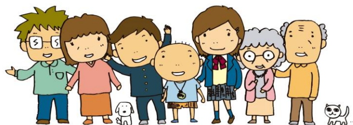
「知るぼると」 イメージキャラクター 矢口ファミリー