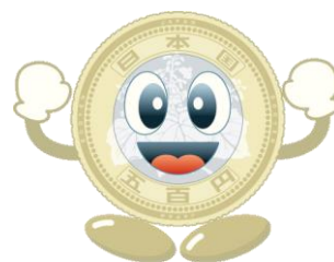
造幣局マスコットキャラクター コインくん