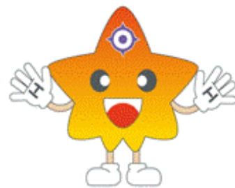
日本銀行広島支店 マスコットキャラクター