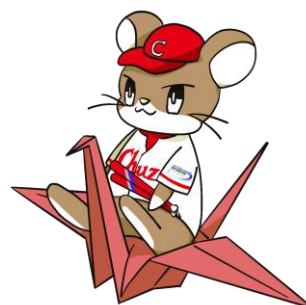
中国財務局マスコットキャラクター ざいちゅう

※11月25日(月)午前10時から受付開始します。 ※ご提供頂いた個人情報は、参加者への案内・運営のために利用し、 ご本人の承諾なしにいかなる第三者にも開示・提供することはありません。